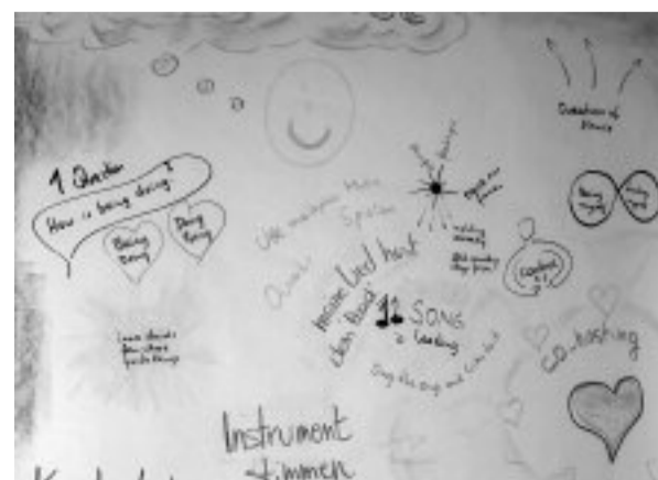
Chaordisch meint: So wenig Struktur wie möglich, soviel Chaos wie möglich, um kreative Prozesse und Innovation durch Emergenz zu ermöglichen, ähnlich dem künstlerischen Prozess. Dee Hock, Die chaordische Organisation, 2008.