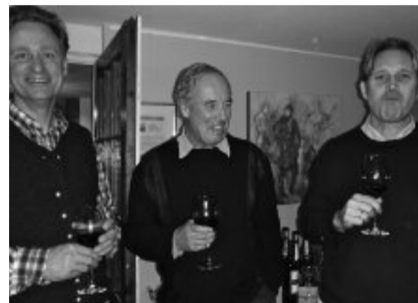
Wenn man es beim ungezwungenen Glas Wein beim Ankommen noch nicht gemerkt hat, so wird spätestens jetzt deutlich: Hier regiert Authentizität.