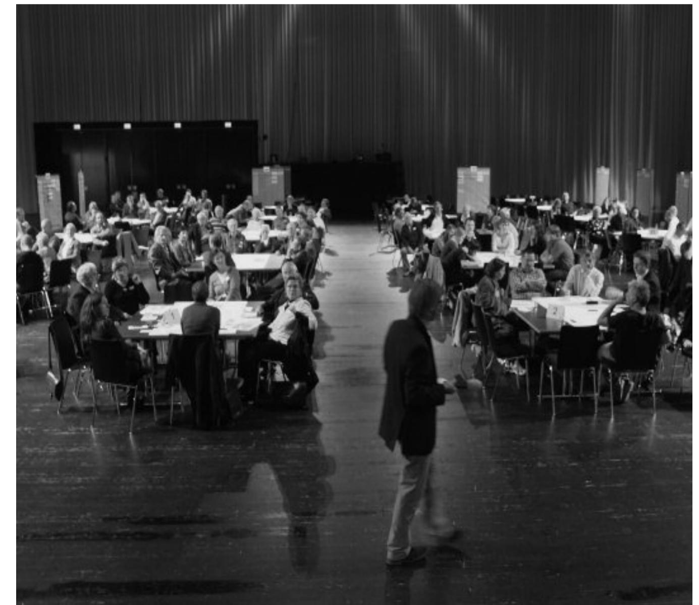
Auftaktveranstaltung zum Bürgerbeteiligungsverfahren für den neuen Kornmarktplatz in Bregenz.

Diese Kommunikationsbemühungen sind nicht selten effekthascherisch und bleiben selbst dann, wenn sie von guten Absichten geleitet sind, oft kurzatmig. In nicht wenigen Fällen erzeugt ein solcher Aktionismus zudem Frustrationen bei denjenigen, sie sich zur Teilhabe eingeladen sahen, aber sich nicht ernst genommen sahen.