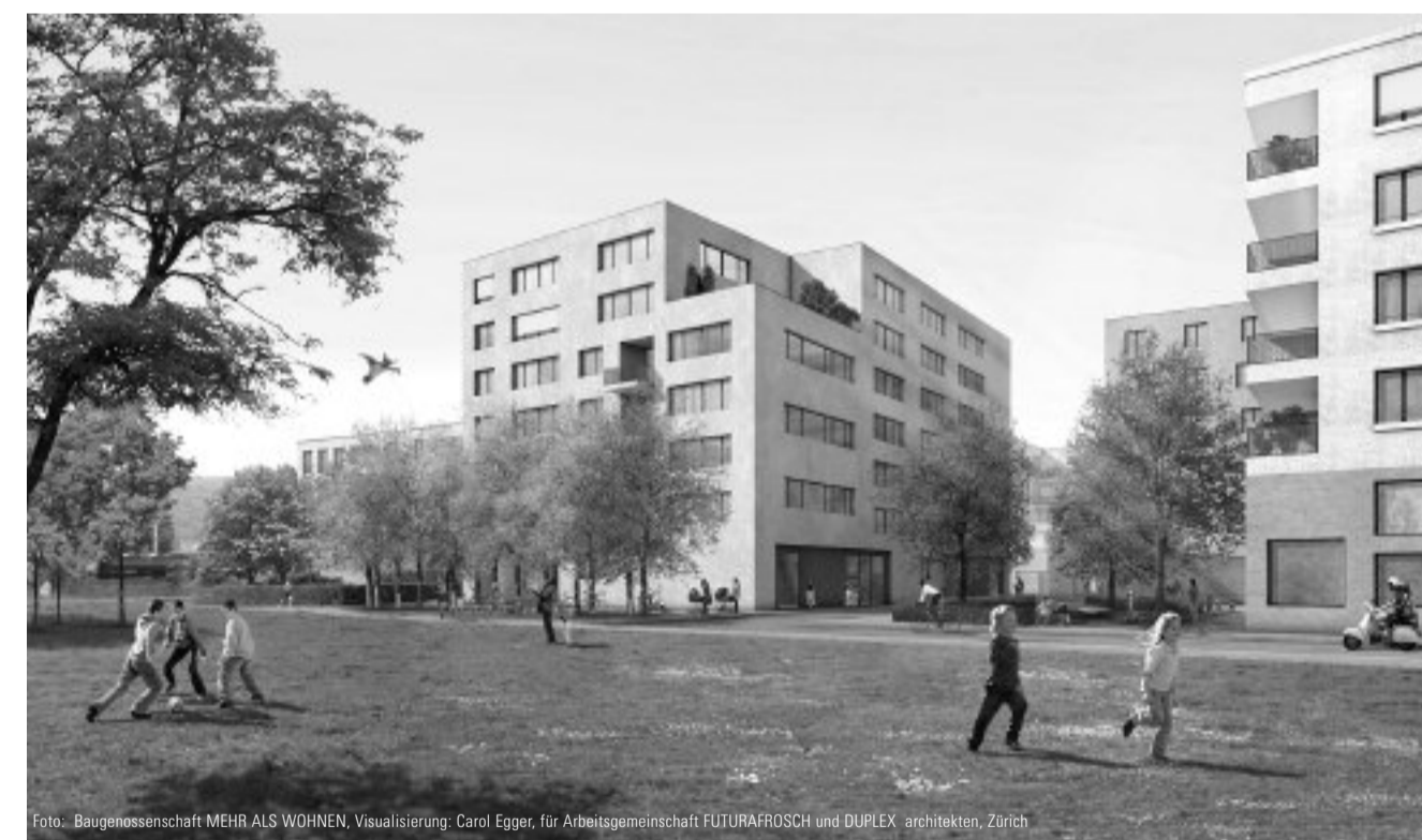
Foto: Baugenossenschaft MEHR ALS WOHNEN, Visualisierung: Carol Egger, für Arbeitsgemeinschaft FUTURAFROSCH und DURLEX architekten, Zürich

Die Fachhochschule Nordwestschweiz FHNW begleitet mit seinem Projekt „Bildung für Nachhaltigkeit“ Institutionen, Unternehmen und Gemeinden bei der Umsetzung der genannten Prozesse. Insbesondere ist es wichtig, dass wir lernen im Sinne von „small is beautiful“ Glück und Wohlstand vom „Größer-schneller-mehr“ abzukoppeln. Gerade in diesen aufgeregten Zeiten gilt es, an unserem Ort eine solidarische und lebenswertere Welt mitzugestalten.