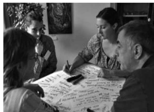
Wesentliche Utensilien sind Tischdecken für freies Zeichnen und Kritzeln. Mit bunten Farben kreativ durcheinander, eben chaordisch, bahnen sich die Bilder ihren Weg vom Unbewussten ins bewusst Manifestierte.