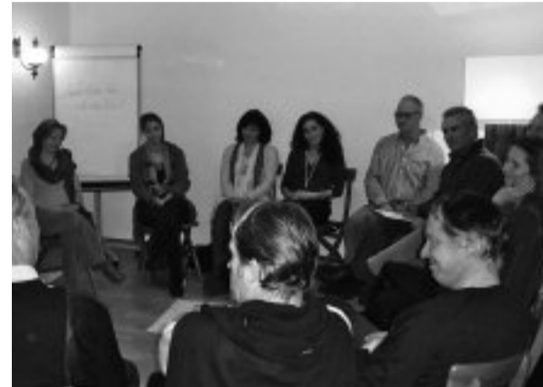
Nach einer kleinen Einführung wissen die Gäste, dass im Bregenzer Salon das gute Zuhören wichtig ist und zur Verlangsamung führt.