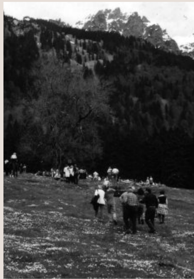
Die Brazer Allmein wurde 2001 gegen die Pläne zur Golfplatz-Erweiterung verteidigt.

Wie oft waren wir von der Gegenseite so titulierten Naturschützer in den letzten Jahren