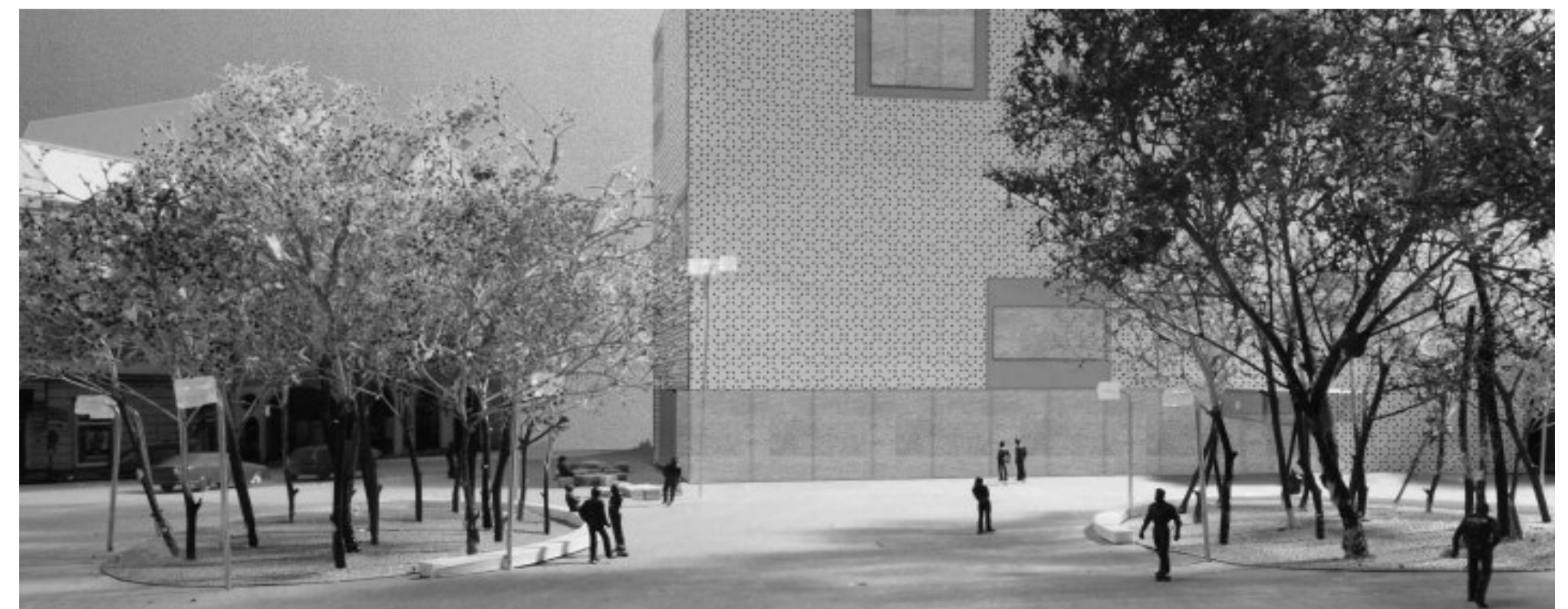
Urbanes Flair für Bregenz: Modellfoto des neuen Kornmarktplatzes.