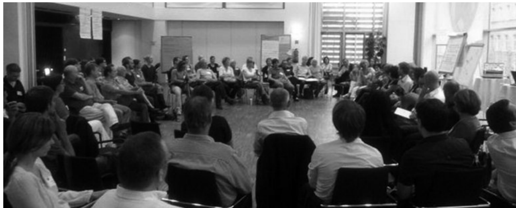
Impressionen vom ersten Jahrestreffen der Bewegung „Gemeinwohl-Ökonomie“ in Wien.